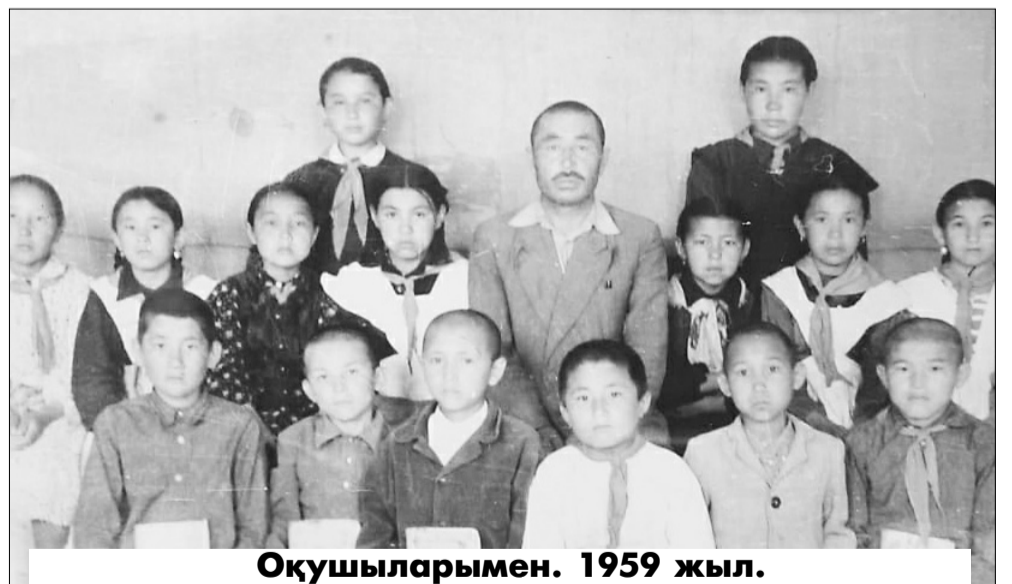
Оқушыларымен. 1959 жыл.