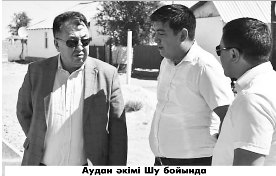
Аудан әкімі Шу бойында