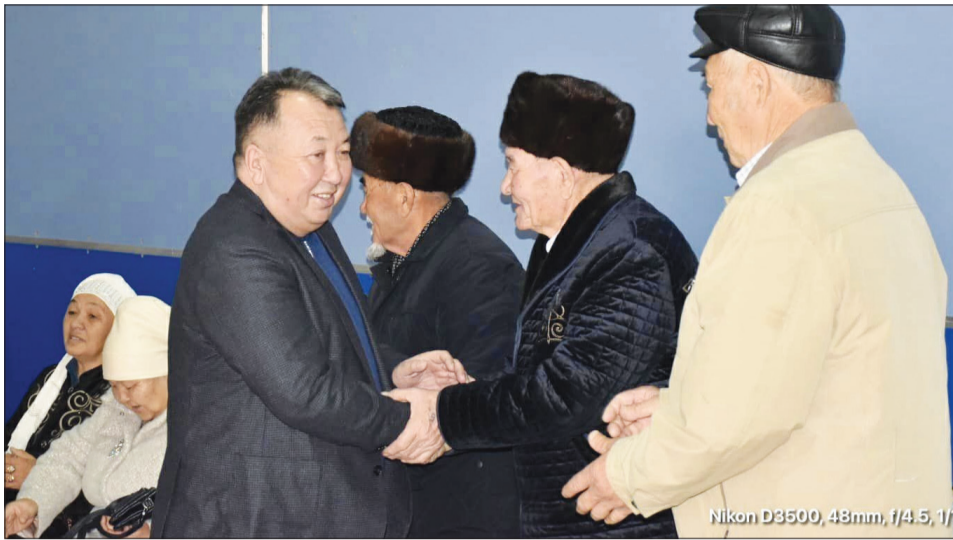
Nikon D3500, 48mm, f/4.5, 1/1

Осы мол байлық яғни, барланған кен орны жағынан Қазақстан әлемде көптеген мемлекеттер ішінен алдыңғы қатарлы орынға шығып, көш бастады.