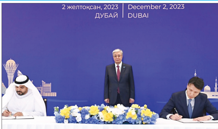
2 желтоқсан, 2023 | December 2, 2023 ДУБАЙ | DUBAI