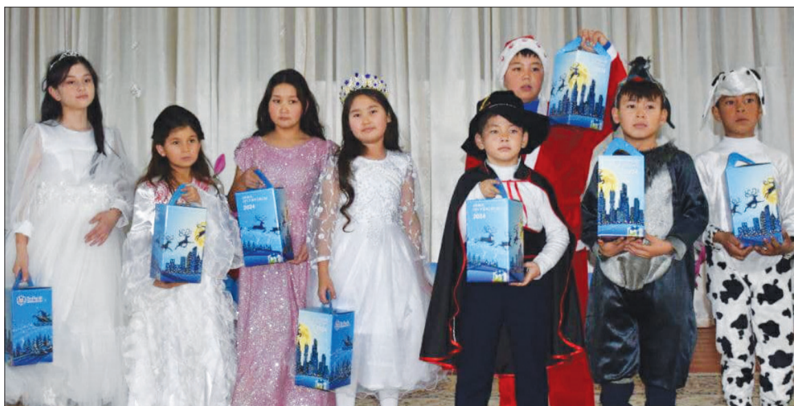
Аудан әкімінің баспасөз қызметі.

шақтар күтіп алды. Мерекелік шараға көп балалы отбасынан шыққан және түрлі байқаулардың жеңімпаздары атанған 200 ге тарта жас бүлдіршіндер қатысты.