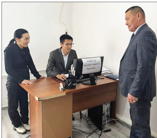
Бақылау барысында бөлім тарапынан ұсынылатын мемлекеттік қызметтердің жағдайымен танысып, қыз-